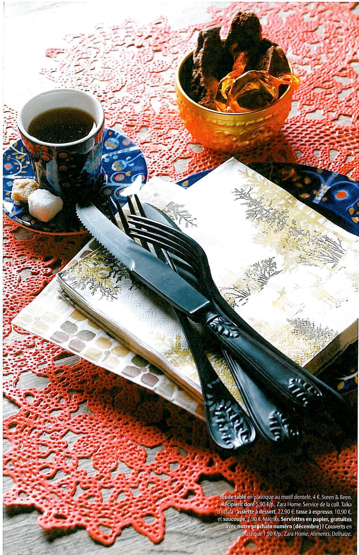
Set de table en plastique au motif dentelé, 4 €, Steen & Been. Récipient doré 5,90 €/p., Zara Home. Service de la coll. Taika d'iittala : assiette à dessert, 22,90 €, tasse à espresso, 10,90 €, et soucoupe, 7,90 €, Matriks. Serviettes en papier, gratuites avec notre prochain numéro (décembre) ! Couverts en plastique 1,90 €/p., Zara Home. Aliments, Delhaize.